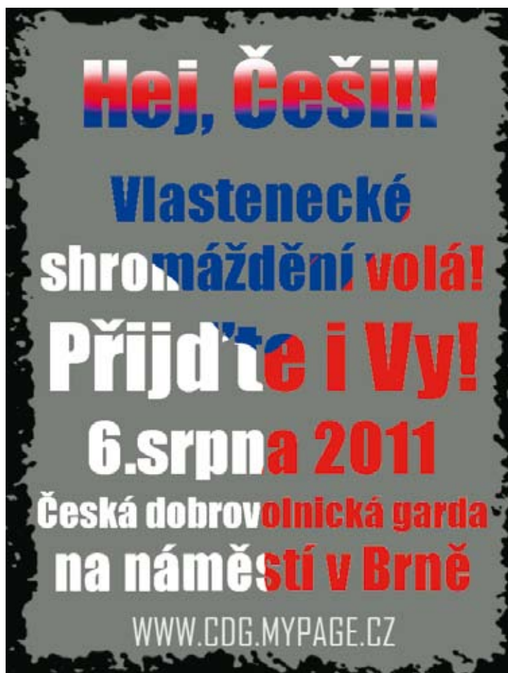
Leták ke srazu neonacistů, na němž chtějí založit dobrovolnickou gardu

Náckové velmi často na internetu uvádějí spolek se zkratkou ČDG. To neznamená, jak by si mohl neznalý myslet, Ču..ci & Dementi Group, ale ČESKÁ DOBROVOLNICKÁ GARDA. Jako kontakt má uvedenu adresu Babice u Rosic a hlásá: „Jsme vlasteneckou organizací, naše priority jsou: 1. Probudit v lidech hrdost a „češství“ Tak jako tomu bylo za dob dřívějších, včetně ctění padlých předků v boji za Českou zem včetně Husitů, ČS legionářů za 1 i 2. světové války. Garda odmítá propagaci jakékoli sexuální úchylinky především, pedofilii, homosexualitu ... Nebudeš obcovat s mužem jako s ženou. Je to ohavnost. Garda odmítá poslušnost EU a všem totalitním uskupením včetně kapitalismu. Garda odmítá aby v čele státu vládli cizinci, stejně tak jako nikdo nebude vládnout z cizinců ČR.“